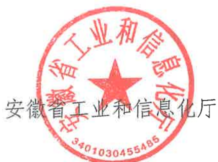
安徽省工业和信息化厅