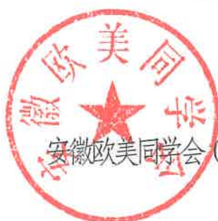
安徽欧美同学会（安徽留学人员联谊会）